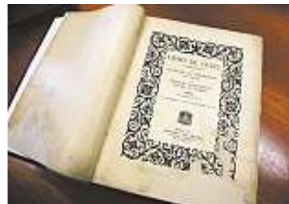
■ 1923: O livro restaurado sobre o Centenário da Independência do Brasil