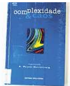
■ 1999: O texto de Moysés Nussenzveig fala da origem da vida