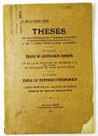
■ 1920: Anatomia, com texto de Carlos Chagas