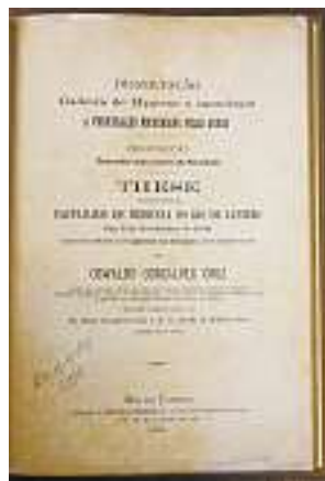
■ 1893: A microbiologia, na visão de Oswaldo Cruz