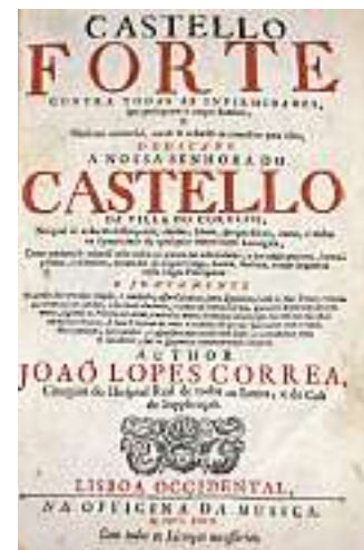
■ 1623: João Lopes Correa abordou o tema patologia

E Cristiane Furtado cristiane.furtado.personale@oglobo.com.br Em dezembro de 2014, a Fundação Oswaldo Cruz, em Manguinhos, vai ganhar um Centro de Documentação e História da Saúde do Brasil (CDHS). O local vai abrigar um acervo único, composto de livros, documentos textuais (telegramas, cartas, postais, artigos científicos, folhetos e currículos), iconográficos (imagens) e sonoros produzidos desde o sécu-