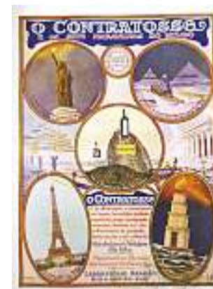
■ 1923: O Centenário da Independência, no texto de Almanack Laemmert

lo XVII (ver legendas com os anos de lançamento) até os dias atuais. O projeto do CDHS foi concebido para reunir o maior e mais expressivo conjunto documental do país sobre os processos políticos, sociais e culturais da saúde. Entre eles, estão os arquivos dos cientistas Oswaldo Cruz e Carlos Chagas, reconhecidos como obras de relevância para a História da Humanidade pelo Programa Memória do Mundo da Unesco, em 2007 e 2008, respectivamente.